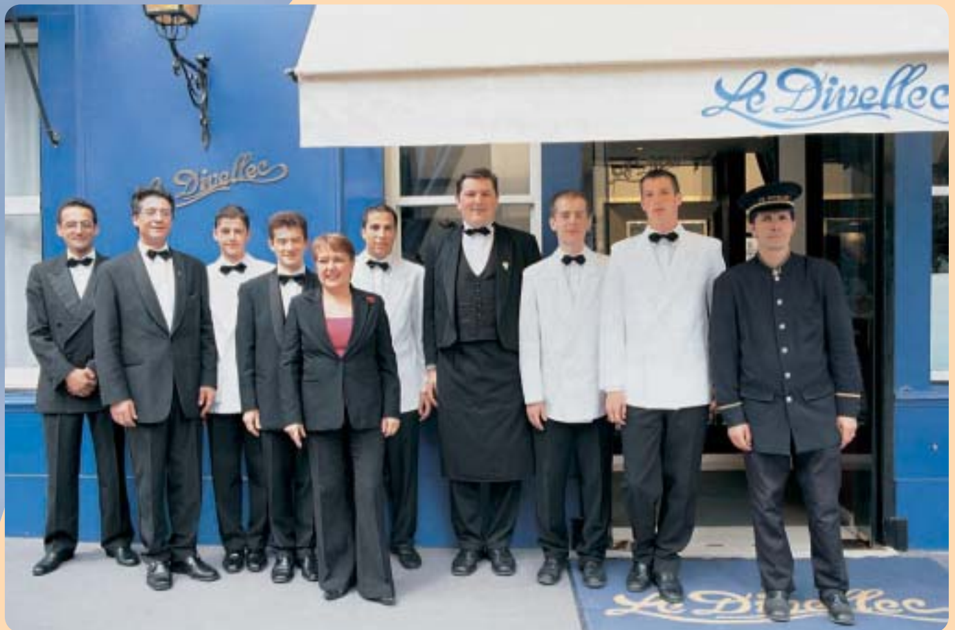
Restaurant Le Divellec, Paris 7 e