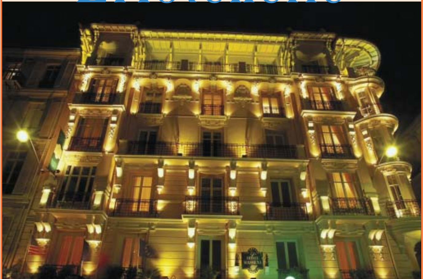
Hôtel Masséna Nice