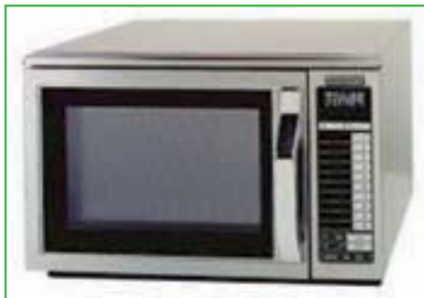
1967 Mise sur le marché de la première enceinte micro-ondes.