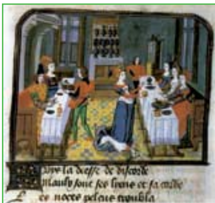
Sur cette miniature, dans l'adaptation par Jean Mielot de l'Épître d'Othéa de Christine de Pisan vers 1460, on remarque les nappes de lin brodées et la vaisselle exposée sur le dressoir à paliers.

Marco Polo fils de commerçant vénitien emprunte « la route de la soie » et atteint la Chine. Il fait le récit de son voyage dans le célèbre manuscrit « le livre des merveilles du Monde ».