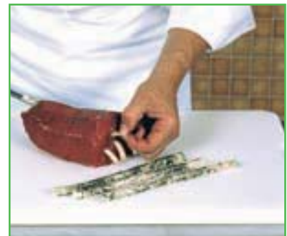
Larder du gîte de bœuf pour braiser