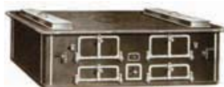
Les premiers fourneaux à charbon puis à gaz remplacent progressivement les potagers maçonnés.