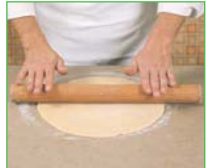
Abaisser de la pâte brisée