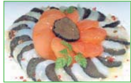
Assiette à base de coquillages crus et cuits