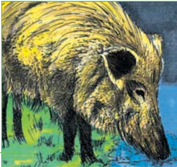
Le sanglier est très apprécié des Gaulois.

L'élevage des abeilles procure le miel qui tient lieu de sucre car celui-ci demeure un produit de luxe.