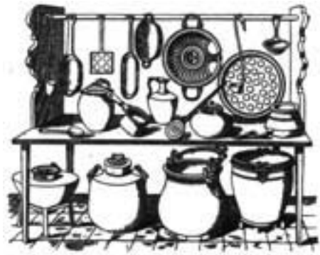
Une cuisine en plein-vent (fresque romaine).