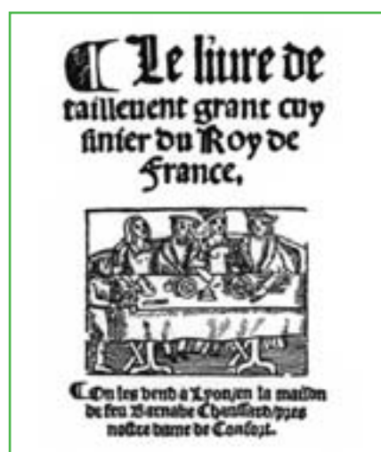
1 er manuscrit de cuisine en langue française Le Viandier de Guillaume Tirel dit Taillevent, couverture d'une réédition (vers 1440).

Guillaume Tirel dit Taillevent, premier queux du roi Charles V en 1373, premier écuyer de cuisine du roi Charles VI en 1381 est anobli en 1382. Il est communément donné pour l'auteur du plus vieux manuscrit de cuisine écrit en français Le Viandier .