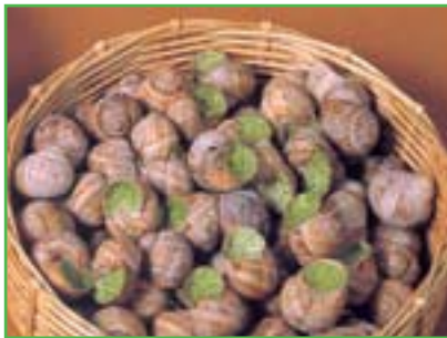
Les Gallo-Romains apprécient les escargots de Bourgogne.

Enfin, la Gaule possède les meilleures sources thermales de l'Empire.