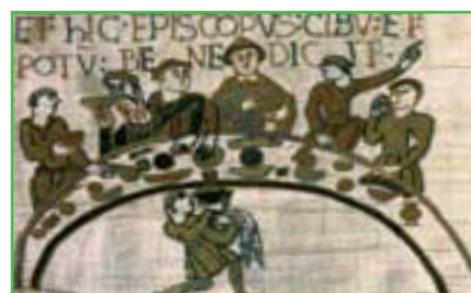
Extrait des Normands à table. Tapisserie de la reine Mathilde, XI e siècle. Musée de Bayeux, Calvados.

Rollon obtient de Charles le Simple la partie de la Neustrie qui prend le nom de Normandie.