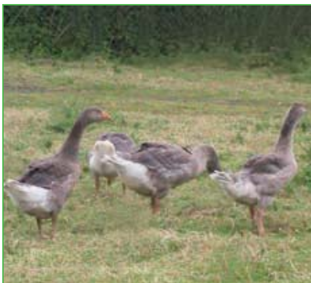
Des troupes d'oies en provenance du Pas-de-Calais sont exportés vers Rome.