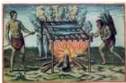
Des pierres chauffées à blanc.