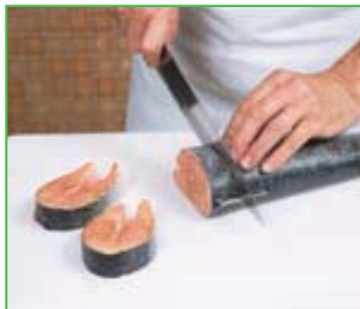
Détailler des darnes de saumon