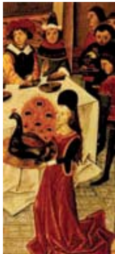
Histoire du Grand Alexandre, manuscrit français du XVI e siècle.

Ce n'est qu'un siècle plus tard, en 1574, sous Henri III avec la mode des collerettes empesées (les fraises) que pour ne pas se tacher l'on prend l'habitude de se nouer la serviette autour du cou, tâche souvent malaisée d'où l'expression « avoir des difficultés à joindre les deux bouts ».