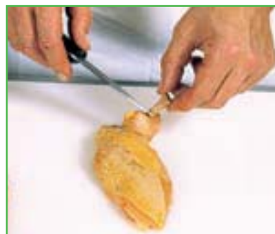
Manchonner des ailes de poulet