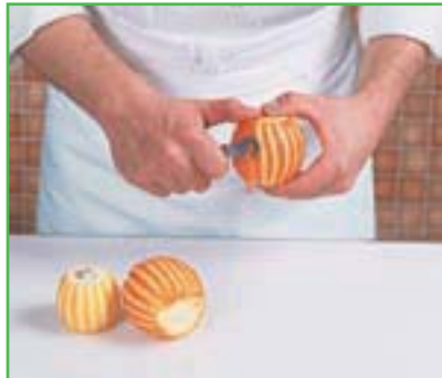
Canneler des citrons et des oranges

Afin d'associer les termes culinaires à un geste, une technique, un produit et à un matériel spécifique, les termes culinaires sont utilisés et étudiés tout au long du manuel de travaux pratiques et résumés à la fin de l'ouvrage ( La Cuisine de Référence, Michel Maincent, Éditions BPI ).