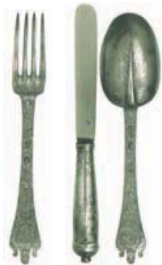
Couverts en argent doré, œuvres du Maître Jean Villain, 1684.

En 1681, le roi précise l'ordre de ses repas. En partant de la cuisine, tous les plats sont recouverts, non seulement pour leur éviter de refroidir, mais aussi pour éviter tout risque d'empoisonnement.